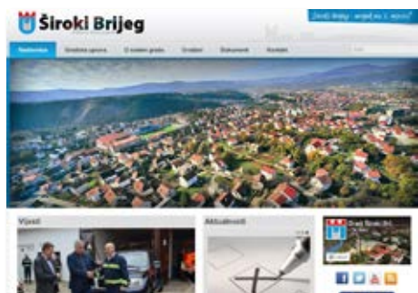
www.sirokibrijeg.ba web-stranica Grada Širokog Brijega