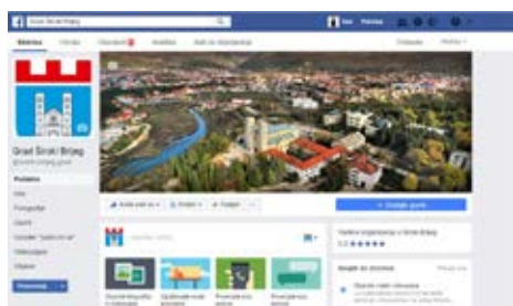
www.facebook.com/Grad-Široki-Brijeg Facebook stranica Grada Širokog Brijega