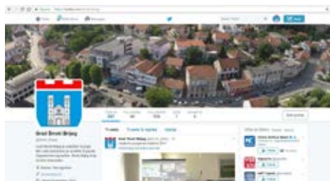
www.twitter.com/Siroki_Brijeg Twitter stranica Grada Širokog Brijega