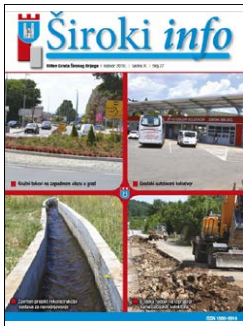
Informativni bilten Grada Širokog Brijega „Široki info“

Prvi broj biltena tada Općine Široki Brijeg pod nazivom 'Široki info' izišao je u kolovozu 2008. godine.