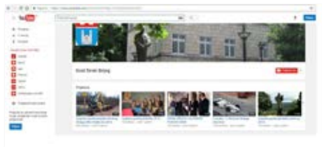
www.youtube.com/GradSirokiBrijeg YouTube kanal Grada Širokog Brijega