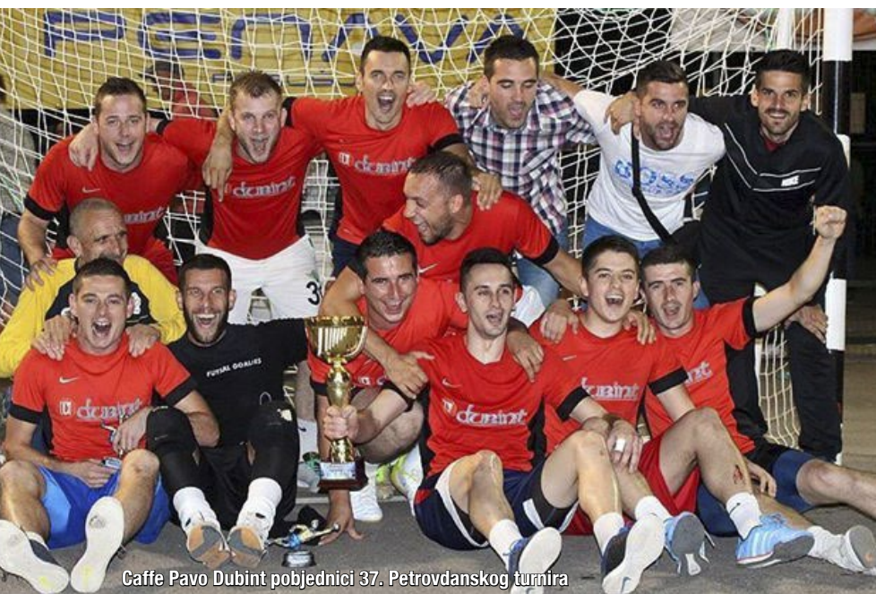
Caffe Pavo Dubint pobjednici 37. Petrovdanskog turnira

U sklopu manifestacija 'Dani Kočerina 2015.' održan je tradicionalni 37. Petrovdanski malonogometni turnir. U finalnoj utakmici ekipa Caffe Pavo Dubint pobijedila je ekipu Vaske Benz rezultatom 2:1. Pobjedničkoj ekipi pripao je pehar i novčana nagrada u iznosi od 6.000 KM, dok je drugoplasirana ekipa, uz pehar, osvojila 2.500 KM. U utakmici za treće mjesto Stomatološka ordinacija Jurčić slavila je protiv Sportskog centra Čorkov dolac rezultatom 4:3 te joj je pripala, uz pehar, novčana nagrada od 1.000 KM, a četveroplasiranoj nagrada od 500 KM. Nakon utakmice, koja je ove godina privukla rekordan broj posjetitelja na igralište škole na Kočerinu, nastupila je glazbena skupina 'Denirom' iz Mostara.