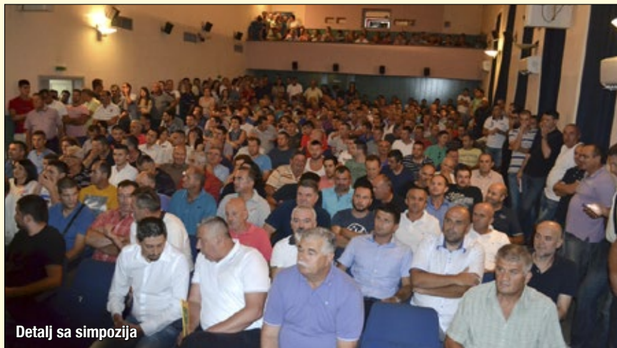
Detalj sa simpozija

„Hercegovina je Bogom dana zemlja za uzgoj ovog bilja i analize po-