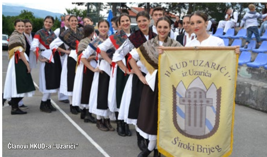
Članovi HKUD-a “Uzarići”