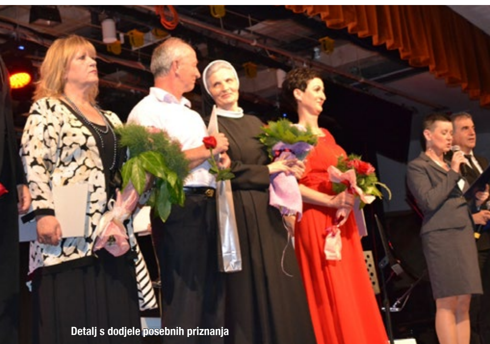
Detalj s dodjele posebnih priznanja

U proteklih 40 godina, od davne 1974./1975. školske godine, kroz osnovnu glazbenu školu prošlo je preko 3.000 djece koji su uz pjevanje, solfeggio i teoriju glazbe, učili svirati jedan od instrumenata: glasovir, gitaru, violinu, flautu, trubu, saksofon, violončelo, harmoniku, orgulje, tamburice... Danas osnovnu i srednju Glazbenu školu pohađa 160 učenika.