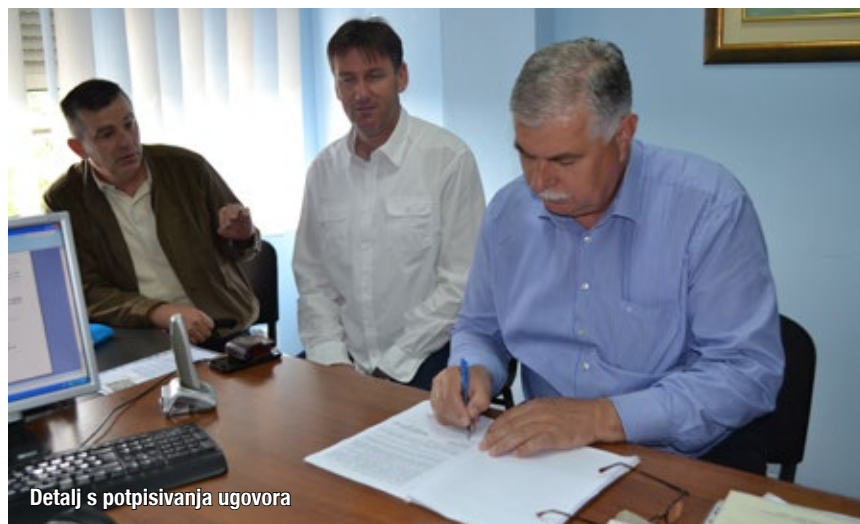
Detalj s potpisivanja ugovora

pna pretpostavljena vrijednost projekta autobusnog kolodvora sa zemljištem će iznositi oko 1,5 milijuna KM.