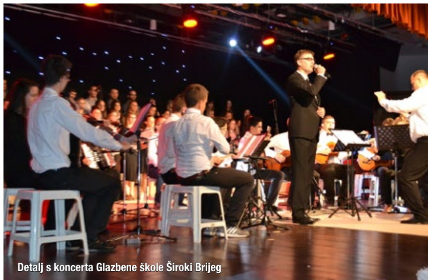
Detalj s koncerta Glazbene škole Široki Brijeg

Sadašnji i bivši učenici Glazbene škole izvodili su djela hrvatskih i svjetskih skladatelja, a gosti koncerta bili su poznati glazbenici Meri Cetinić i Ivan Mikulić. Meri Cetinić je uz pratnju djevojačkog zbora nastupila s pjesmom 'Zemlja dide mog', a Ivan Mikulić je uz pratnju zbora i orkestra izveo Puccinijevu ariju 'Nessum dorma'. Meri Cetinić je osamdesetih godina prošlog stoljeća aktivno surađivala sa Glazbenom školom Široki Brijeg čiji je pjevački zbor nastupao zajedno s njom i na poznatom Splitskom festivalu, ali i na koncertima ove poznate hrvatske pjevačice. Ivan Mikulić koji je bivši učenik škole vrhunac svoje karijere je imao predstavljajući Hrvatsku na Euroviziji 2004. godine. Obilježavanje jubileja započelo je 29. svibnja kada je u Narodnoj knjižnici otvorena izložba fotografija pod nazivom "40 godina