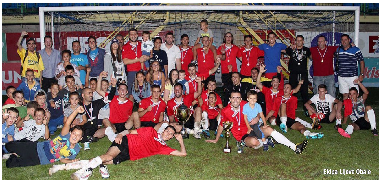
Ekipa Lijeve Obale