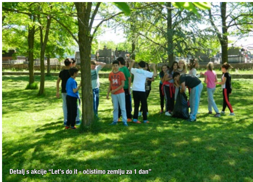
Detalj s akcije "Let's do it - očistimo zemlju za 1 dan"

U Širokom Brijegu je 11. svibnja provedena akcija čišćenja gradova u Bosni i Hercegovini pod nazivom 'Let's Do It - očistimo zemlju za 1 dan'. Nositelj ove akcije je Služba za prostorno uređenje i zaštitu okoliša Grada Širokog Brijega. Učenici osnovnih i područnih škola, te učenici srednjih škola njih oko 4.000 su se odazvali akciji čišćenja prostora oko škola i korita rijeke Lištice. Grad Široki Brijeg i Udruga 'Ruke' osigurali su potrebna sredstva za realizaciju ove akcije, a prikupljeni otpad odvozili su djelatnici JPK 'Čistoća'. Ovo je četvrta godina zaredom da se akcija čišćenja 'Let's Do It - očistimo grad za 1 dan' provodi i u Širokom Brijegu.