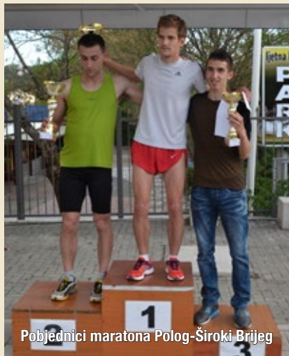
Pobjednici maratona Polog-Široki Brijeg