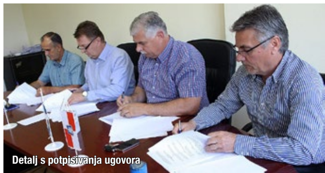
Detalj s potpisivanja ugovora

Prema ovom Ugovoru, Vlada Županije Zapadnohercegovačke sufinancirat će prijevoz učenika u ukupnom iznosu od 800.000 KM. Iznos sredstava koji će biti dodijeljen gradu/općinama određen je na temelju broja učenika osmih razreda osnovnih škola, tako da će Gradu Širokom Brijegu biti dodijeljena sredstva u ukupnom iznosu od 266.166 KM.