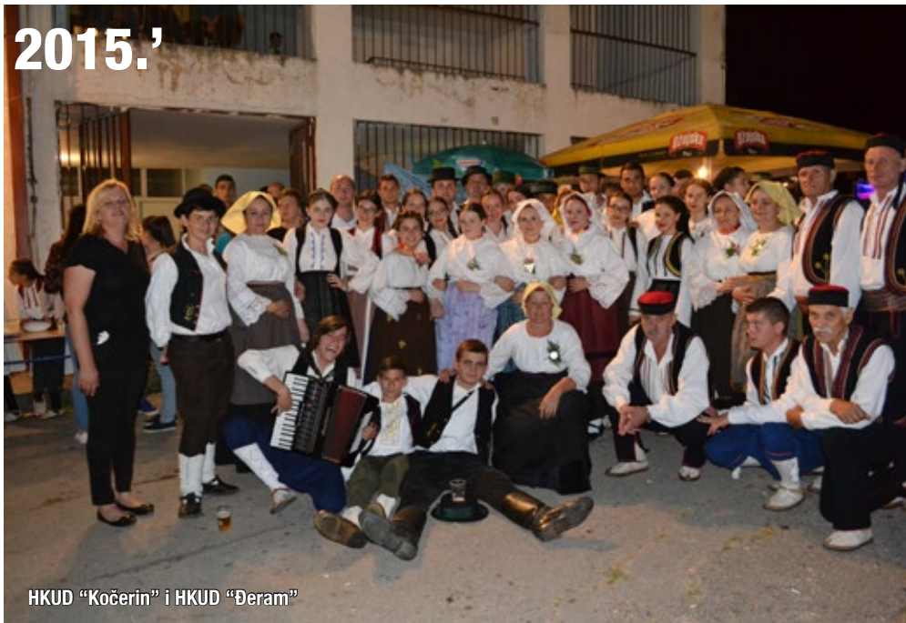
HKUD „Kočerina“ i HKUD „Đeram“