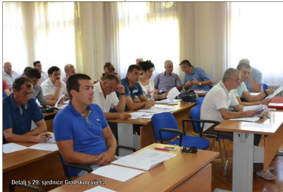
Detalj s 29. sjednice Gradskog vijeća

Vijećnici su primili na znanje Informaciju o stanju voznog parka Gradske