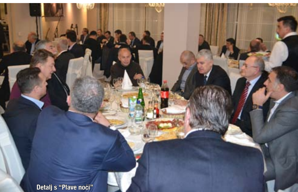
Detalj s "Plave noći"

Nogometašice Širokog Brijega u Nogometnom kampu Musa-Karačić na Mostarskom blatu odigrale su 14. ožujka 2015. prvu utakmicu u povijesti kluba te proslavile ujedno i prvu pobjedu svladavši Čaplinu člana Prve ženske lige FBiH u prijateljskom susretu rezultatom 4:2. ŽNK Široki Brijeg s treninzima je počeo sredinom listopada 2014. godine, a za svega nekoliko mjeseci klub je 'izbacio' četiri reprezentativke Bosne i Hercegovine. Utakmica s Čaplinom bila im je prva u povijesti kluba, a u rujnu ove godine ŽNK Široki Brijeg priključit će se Prvoj ženskoj ligi Federacije BiH.