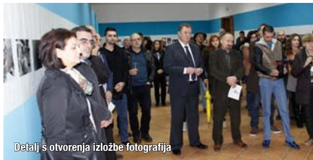
Detalj s otvorenja izložbe fotografija

U prostorijama Akademije likovnih umjetnosti 3. prosinca 2014. upriličena je izložba fotografija nastalih na kiparskoj koloniji 4. Posuških kamendana. Tijekom ovogodišnjih 4. Posuških kamendana po prvi puta je organizirana i 1. kiparska kolonija koja je plod suradnje organizatora Turističke zajednice ŽZH i Općine Posušje, te njihovih partnera Akademije likovnih umjetnosti Široki Brijeg Sveučilišta u Mostaru, klesarske škole Posušje i Razvojne agencije ŽZH - HERAG. Tom prilikom klesari su osam skulptura ostavili u trajno vlasništvo svojim prijateljima u Posušju.