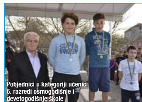
Pobjednici u kategoriji učenici 6. razredi osmogodišnje i devetogodišnje škole