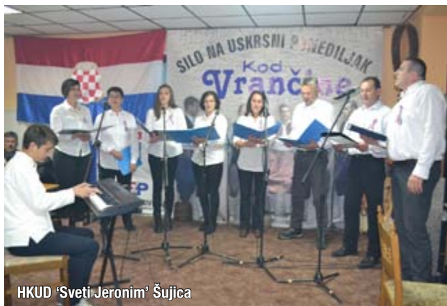
HKUD 'Sveti Jeronim' Šujica