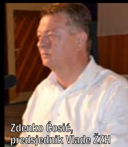
Zdenko Čosić, predsjednik Vlade ŽZH

Skupština Županije Zapadnohercegovačke na 5. redovitoj sjednici održanoj 4. veljače 2015. donijela je Odluku o razrješenju Vlade Županije Zapadnohercegovačke i Odluku o potvrđivanju Vlade Županije Zapadnohercegovačke u sastavu: