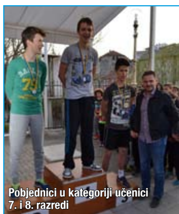
Pobjednici u kategoriji učenice 7. i 8. razredi