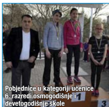
Pobjednice u kategoriji učenice 6. razredi osmogodišnje i devetogodišnje škole

Svim pobjednicima dodijeljene su medalje, a u utrci je sudjelovalo preko 300 učenika i učenica.