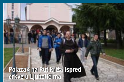
Polazak na Put križa ispred crkve u Ljubotićima