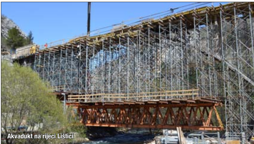
Akvadukt na rijeci Lištici

U Gradskoj vijećnici Širokog Brijega 10. veljače 2015. održan je još jedan sastanak predstavnika izvođača radova, nadzora i drugih sudionika oko provedbe projekta rekonstrukcije hidro-melioracijskog sustava. Na sastanku se raspravljalo o dosadašnjem tijeku izvođenja radova i problemima koji se