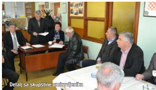
Detalj sa skupštine umirovljenika

Na redovitoj godišnjoj Skupštini Udruge umirovljenika Široki Brijeg, održanoj 24. veljače 2015., pored uobičajenog dnevnog reda, mogli su se čuti vapaji za stanje u kojemu se nalaze umirovljenici, populacija ljudi koji su cijeli svoj radni vijek izdvajali za svoju treću životnu dob, da bi se danas uvjerali da od skromnih mirovina ne mogu preživjeti. U izvješću o radu, pročitane su samo neke od aktivnosti, kojima je ova udruga brinula o svojim članovima tijekom protekle godine. Kada se radi o financijama, može se primijetiti da je ova Udruga, jedna od rijetkih, koje su prošle godine poslovale pozitivno. Udruga se zahvalila svim onima koji su joj pomagali tijekom protekle godine, posebice ističući susretljivost predsjednika Gradskog vijeća Vinka Topića i gradonačelnika Širokog Brijega Miru Kraljevića.