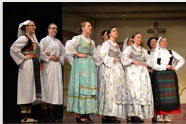
Briješka zvana 2015.