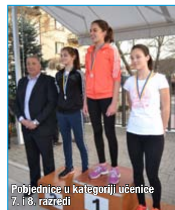
Pobjednice u kategoriji učenice 7. i 8. razredi