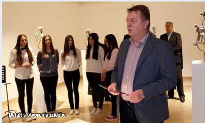
Detalj s otvorenja izložbe

Brijega. Djetinjstvo i mladost proveo je u Bapskoj pokraj Vukovara, u Borovu i Slavonskom Brodu, a radni vijek u Puli. Dosad se predstavio sa 23 samostalne izložbe. Autor je spomenika poginulim pripadnicima Hrvatske ratne mornarice u Novigradu pokraj Zadra i spomen križa u Bapskoj. Bio je član Udruge za likovnu i književnu djelatnost prognanika „Vukovar“, HKD Napredak - Pula, te ULIKS-a iz Pule. Preminuo je 31. kolovoza 2013.