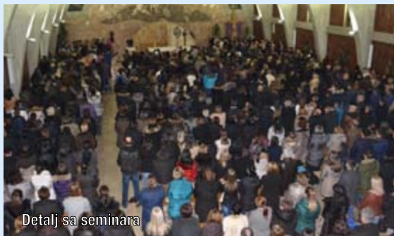
Detalj sa seminara

gdje se Boga svodi na pojavu i višu silu, a ne na onoga koji je stvorio i treba upravljati ljudskim životima. Predavač je govorio i o masonskim idejama, te o praksi Joge i Reikia koji se nude kao nova duhovna ponuda. Govor o pobačaju, eutanaziji i o drugim moralnim pitanjima kod slušatelja je izazvao veliku pozornost. Posljednjega dana seminara bilo je govora o ključnom pitanju vjere, a to je Isusovo uskrsnuće, poziv na obraćenje i vječno spasenje. Trodnevni seminar je završio klanjanjem Isusu u Presvetome Oltarskome sakramentu. Tijekom seminara pjevanje su predvodili kočerinski framaši i 'Širokobriješki dukati'.