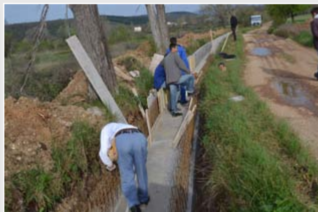
Projekt rekonstrukcije sustava za navodnjavanje