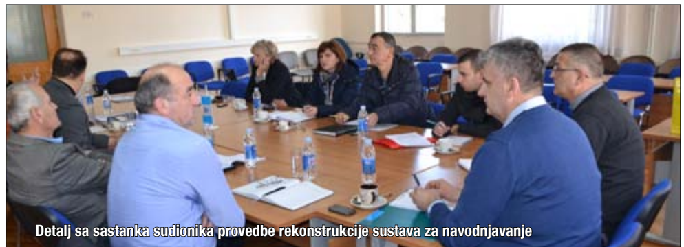
Detalj sa sastanka sudionika provedbe rekonstrukcije sustava za navodnjavanje

U Gradskoj vijećnici Širokog Brijega 10. veljače 2015. održan je još jedan sastanak predstavnika izvođača radova, nadzora i drugih sudionika oko provedbe projekta rekonstrukcije hidro-melioracijskog sustava. Na sastanku se raspravljalo o dosadašnjem tijeku izvođenja radova i problemima koji se