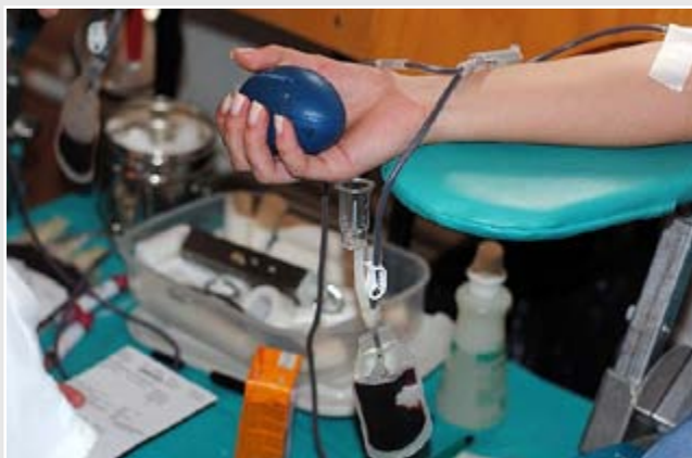
Humanost na djelu - rekordan odaziv darivatelja krvi