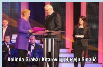
Kolinda Grabar Kitarović i Husejn Smajić

U Hrvatskom domu hercega Stjepana Kosače u Mostaru, 26. ožujka 2015., po je pod pokroviteljstvom Predsjedništva BiH održan Večernjakov pečat. Osobom godine proglašen je Husejn Smajić - Bugojanac u čijem su dvorištu pronađeni ostaci srednjovjekovne katoličke crkve i koji želi da se ta crkva ponovno izgradi. Među brojnim uglednim uzvanicima, Pečatu je nazočila i predsjednica Republike Hrvatske Kolinda Grabar-Kitarović koja je ujedno i uručila nagradu za osobu godine.