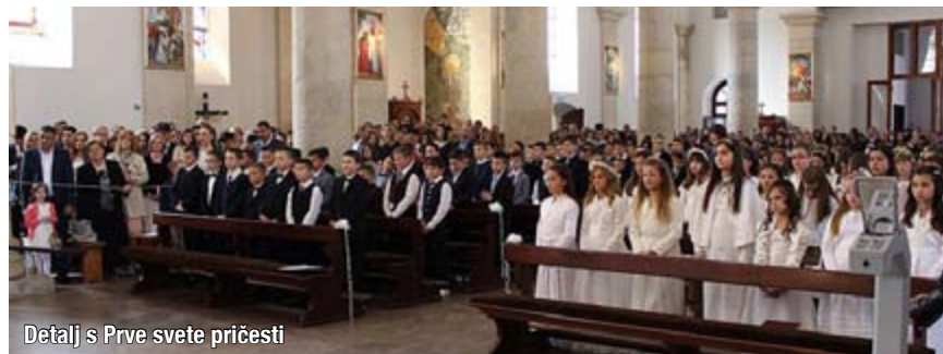
Detalj s Prve svete pričesti

Tijekom mise prvopričesnici su recitali pjesmice, pjevali, prinostili darove, te aktivno sudjelovali u svetoj misi.