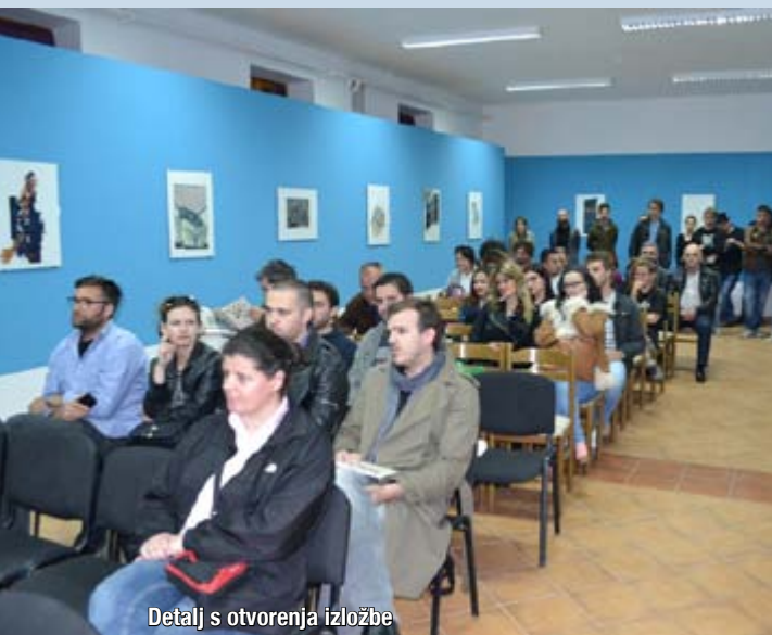
Detalj s otvorenja izložbe