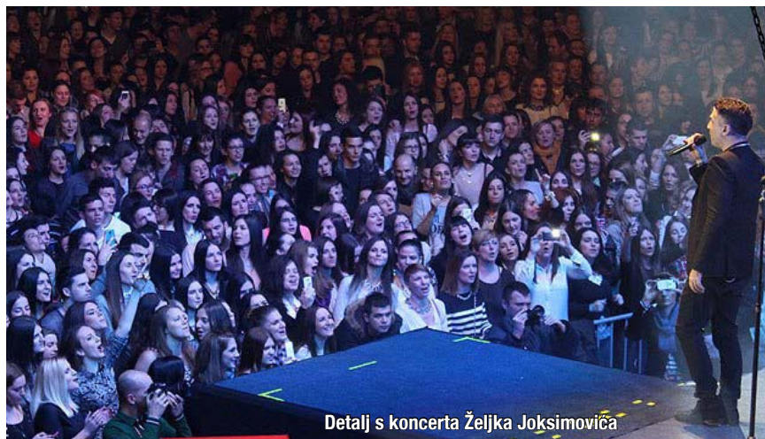
Detalj s koncerta Željka Joksimovića