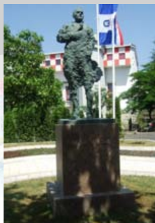
■ Bleiburg - Križni put 1945.