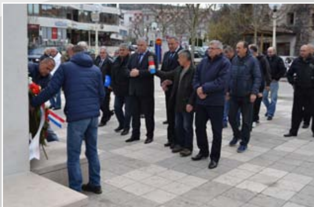
Da se ne zaboravi