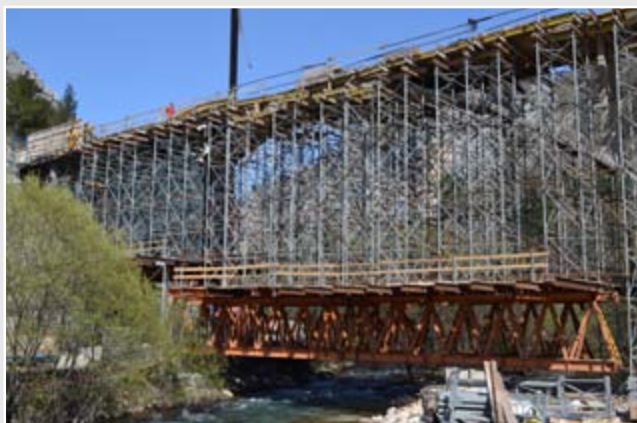
Rekonstrukcija akvadukta u Borku

Bilten Grada Širokog Brijega | siječanj - ožujak - lipanj 2015. | Godina VIII. | Broj 24 - 25