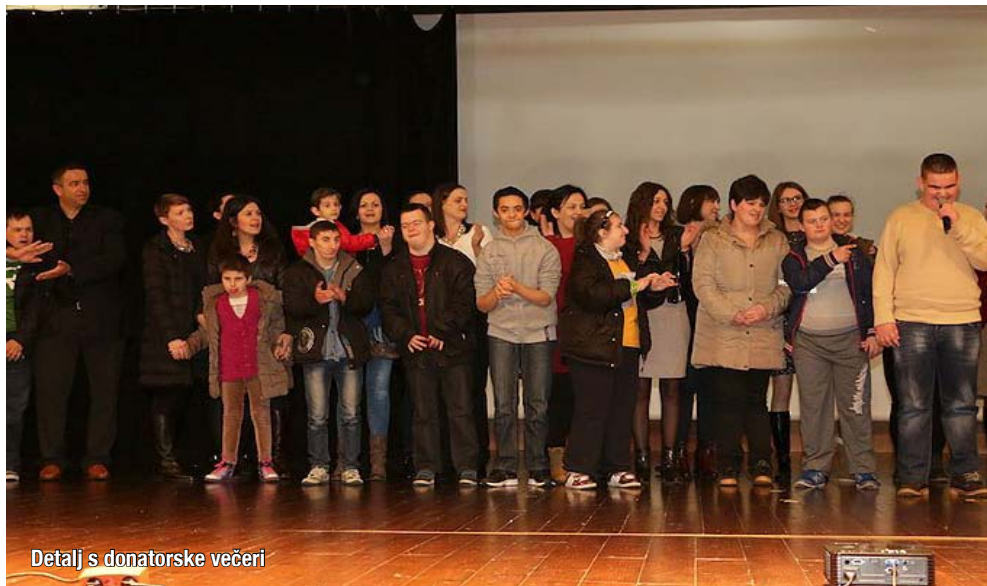
Detalj s donatorske večeri

Dom za djecu s poteškoćama u tjelesnom i/ili psihičkom razvoju "Marija naša nada" ustanova je za rehabilitaciju djece s oštećenjem kognitivnog i/ili motoričkog razvoja. Dom je započeo s radom 5. rujna 2004. godine kao plod suradnje: