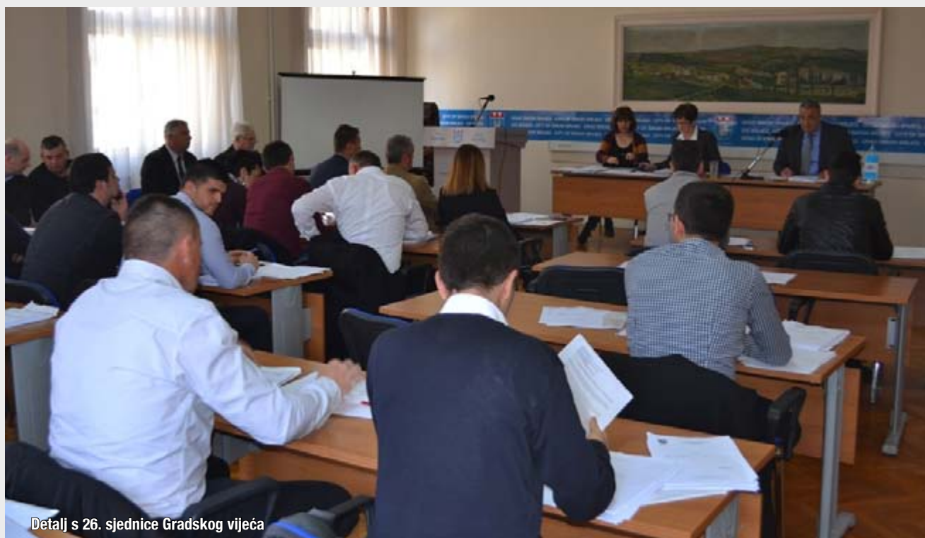
Detalj s 26. sjednice Gradskog vijeća

Prijenos sjednica Gradskog vijeća može se uživo pratiti na službenoj web-stranici Grada Širokog Brijega / www.sirokibrijeg.ba/ i putem valova Radio postaje Široki Brijeg na 92.7, 93.1 i 102.3 MHz.