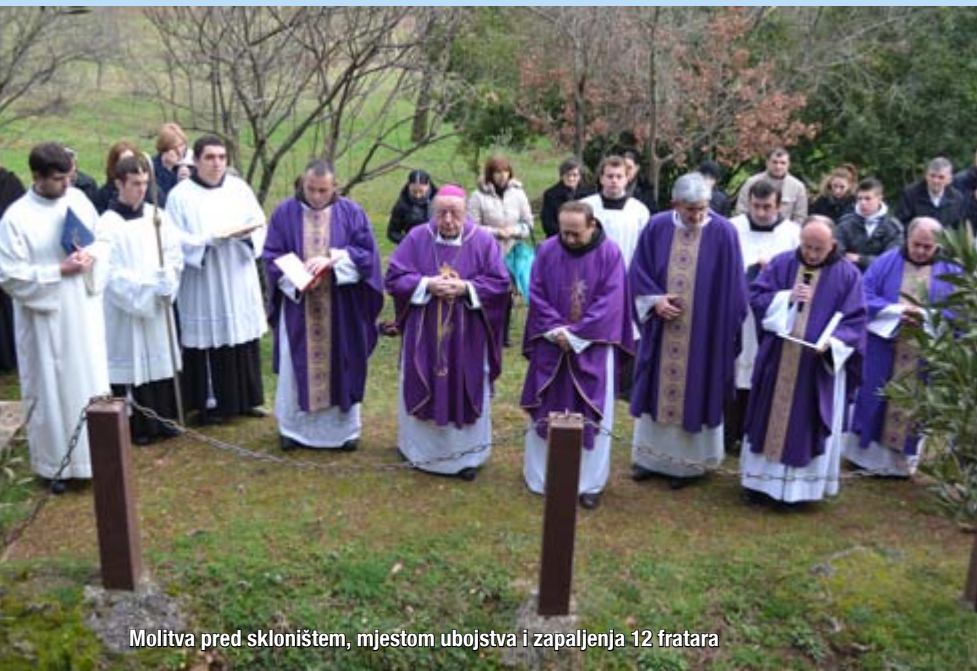
Molitva pred skloništem, mjestom ubojstva i zapaljenja 12 fratara