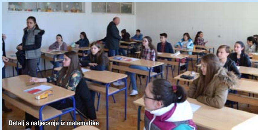
Detalj s natjecanja iz matematike