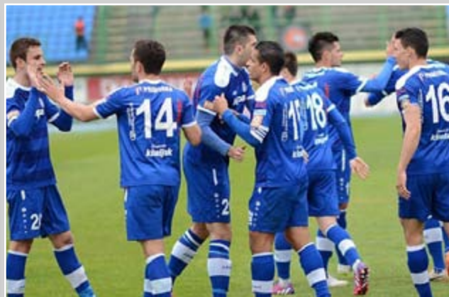
Široki Brijeg - grad športa