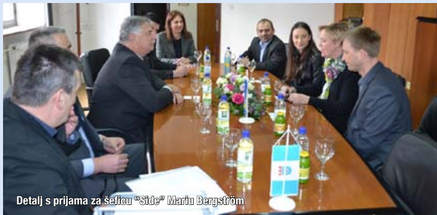
Detalj s prijama za šeficu "Side" Mariu Bergström

'Side' u više razvojnih projekata u Širokom Brijegu, te poželio daljnju suradnju u realizaciji projekata GOLD i WAT-SAN. Šefica Švedske razvojne agencije ('Sida') Marie Bergström sa suradnicima je posjetila i Akademiju likovnih umjetnosti, te širokobriješku tvrtku 'TEM Mandeks' kao uspješnu proizvodnu tvrtku koja je sudjelovala u projektu CREDO Hercegovina podržanom od Švedske razvojne agencije.