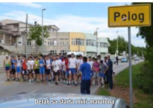
Detalj sa starta mini-maratona

Pobjednik mini-maratona Polog - Široki Brijeg, koji se tradicionalno održava u