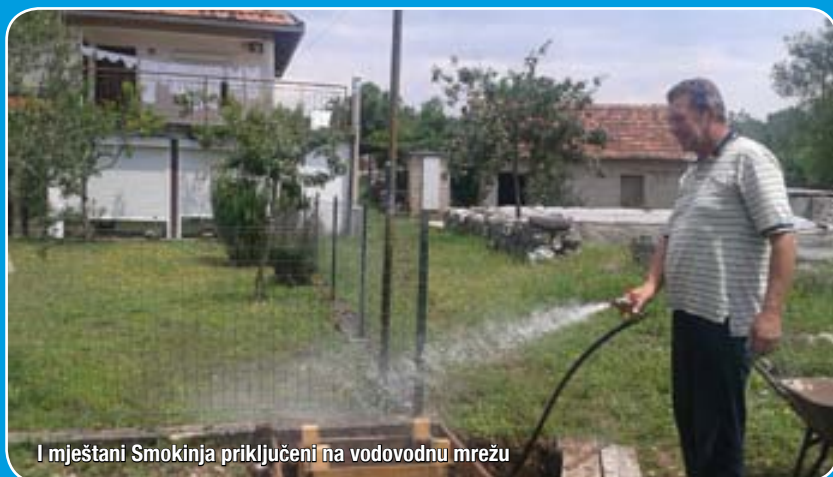
I mještani Smokinja priključeni na vodovodnu mrežu

U lipnju je u rad pušten vodovod Dužice sa 160 priključaka. U tijeku su radovi na izgradnji vodovoda za Rasno, te su stvorene pretpostavke za nastavak radova za Čerigaj. U sklopu vodovoda Dužice mještani Staja i Smokinja su također priključeni na ovu vodovodnu mrežu.