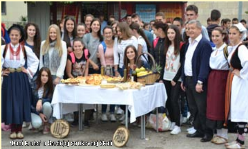
'Dani kruha' u Srednjoj strukovnoj školi

kruha, osnovne životne namirnice. Na ovaj dan učenici sa svojim roditeljima, učiteljima, nastavnici i profesorima pripreme stolove prepune kruha, tradicionalnih pekarskih proizvoda, slatkih i slanih peciva, ali i voća i povrća.