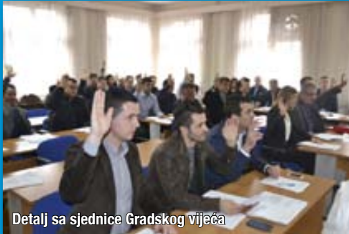
Detalj sa sjednice Gradskog vijeća

Na 22. sjednici Gradskog vijeća Širokog Brijega održanoj 19. studenoga 2014. jednoglasno je usvojena Privremena statutarna odluka prema kojoj se dosadašnja Općina Široki Brijeg proglašava GRADOM .