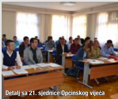
Detalj sa 21. sjednice Općinskog vijeća

■ Na 17. sjednici Općinskog vijeća održanoj 30. travnja 2014. usvojena je Odluka o utvrđivanju uvjeta i kriterija za konačna imenovanja na pozicije u regulirana tijela Općine Široki Brijeg. Ovom odlukom utvrđuju se uvjeti i kriteriji za imenovanje članova Nadzornih odbora javnih poduzeća i Upravnih vijeća javnih ustanova i školskih odbora koji su u nadležnosti Općine Široki Brijeg. Razlog za donošenje ove odluke je usuglašavanje sa