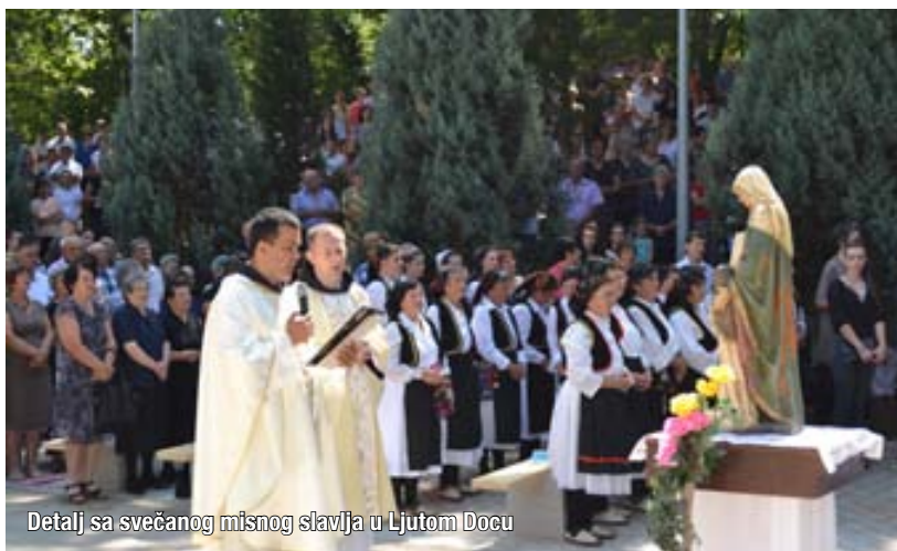
Detalj sa svečanog misnog slavlja u Ljutom Docu