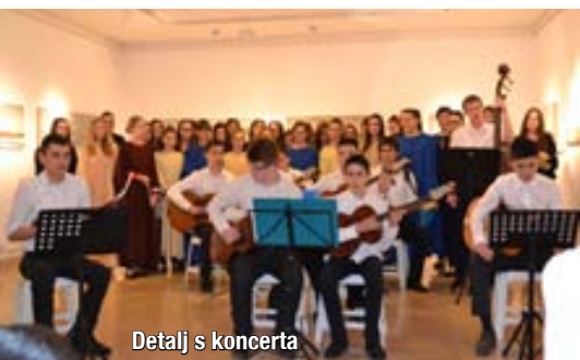
Detalj s koncerta