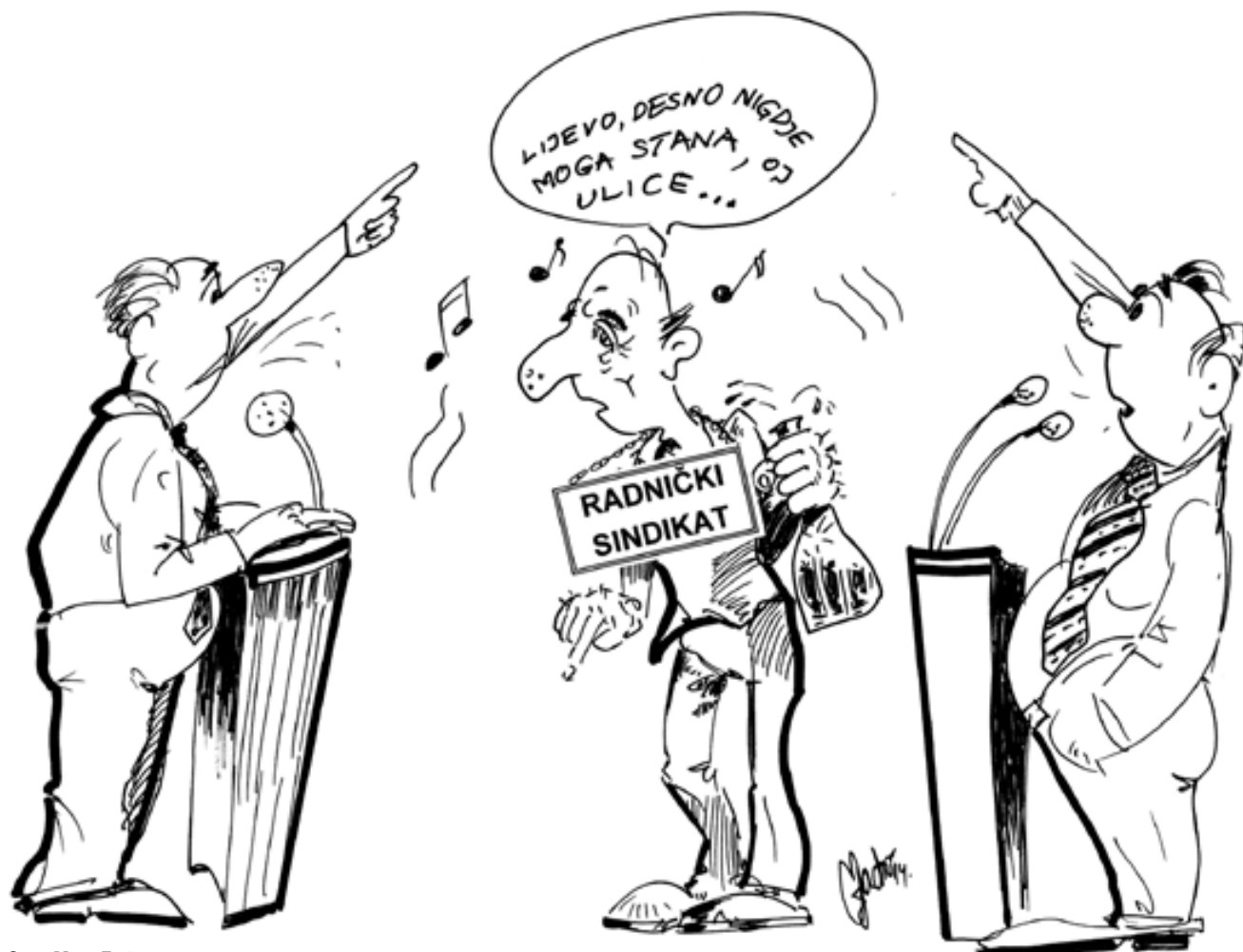
Crta: Mate Zadro