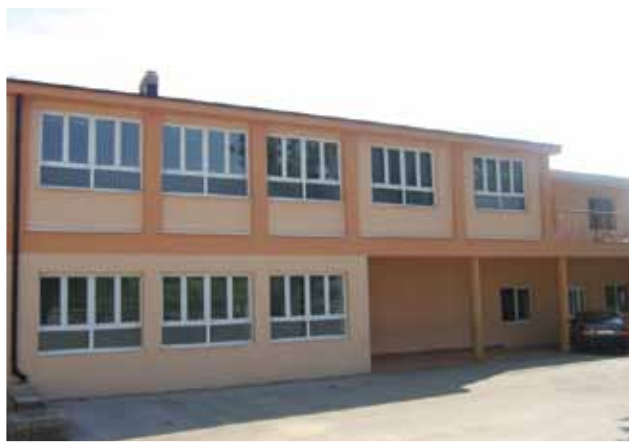
Područna škola Ljuti Dolac