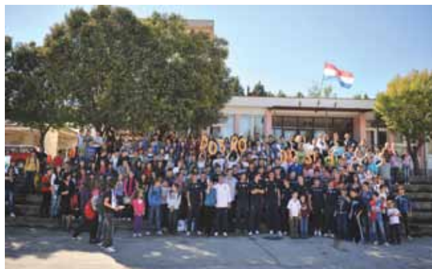
Osnovna škola Biograci

njegova novoga broja (3) u završnoj je fazi. Svoje veliko srce Blaćani će još jednom pokazati time što će cjelokupan prihod od prodaje trećega broja Gradine (kao što je bio slučaj s prethodna dva) usmjeriti u humanitarne svrhe.