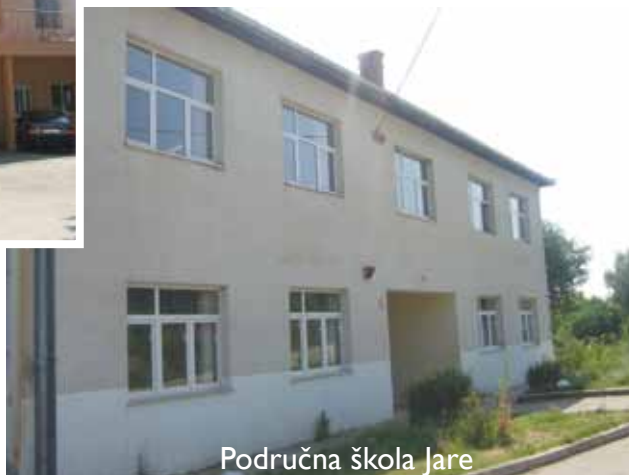
Područna škola Jare